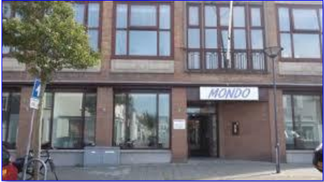
እንቋዕ ብደሓን መጻእኩም